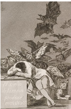
El sueño de la razón produce monstruos Francisco de Goya (1799).

En la Internacional Situacionista, la teoría y un análisis crítico de la llamada "sociedad del espectáculo" son considerados fundamentales para tener la posibilidad de crear "procedimientos originales", que no cayeran en la reproducción del mito de la acción revolucionaria clásica, la cual, a fin de cuentas, había conducido tanto al Terror de Robespierre (después de la Revolución francesa)