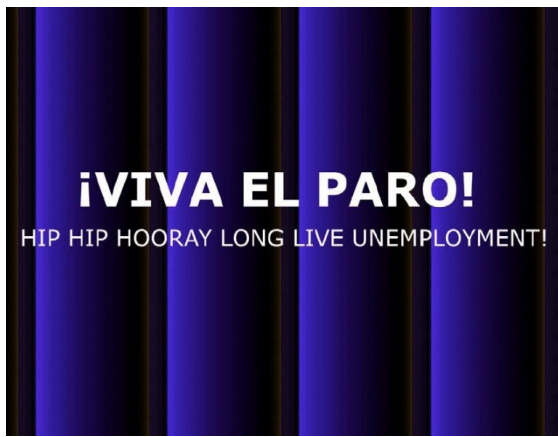
Caja de Luz del Colectivo Libres para Siempre , 1998.

La cuestión central para la Internacional Situacionista, entonces, no es llevar una teoría política a la práctica por medio de una acción revolucionaria clásica, sino superar el retraso de la teoría en relación con los avances del capitalismo