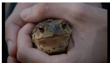
Plano detalle que cierra la película.

no con lo que buscan: “el guisante” –“Fue entonces cuando comprendí el cuento de hadas de La princesa y el guisante . Ella no buscaba al príncipe; buscaba el guisante”–, sino con lo que no buscan, pero con lo que, no obstante – diría a la requeniana– sueñan 59 ... esa “rana” que palpita en la mano del “príncipe”: